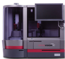
全自動輸血検査装置