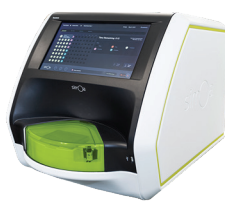
超高感度バイオマーカー検出