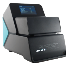
自動核酸抽出装置