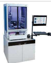
フローサイトメトリー 自動サンプル前処理装置