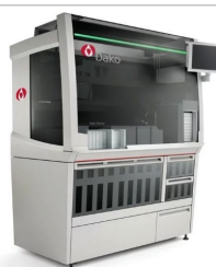
次世代全自動 IHC/ISH 染色装置